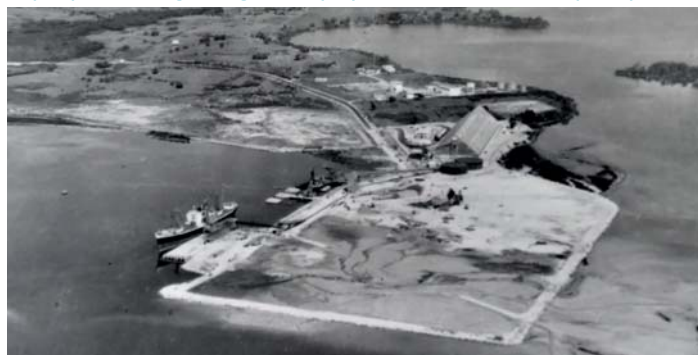
L'aménagement portuaire de la Pointe Jarry en 1969

Pour synthétiser le travail réalisé durant ce projet et permettre au plus grand nombre (partenaires scientifiques et institutionnels de l'OHM, grand public) d'y avoir accès, une cartographie narrative a été réalisée. Ce type de cartographie repose sur de l'information géographique numérique, restituée sous forme dynamique et interactive, accessible par Internet. Notre cartographie a été établie à partir de la plateforme Story Maps développée par la société ESRI.