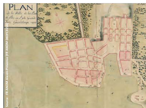
La ville de Pointe-à-Pitre vers 1775