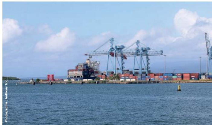
Le terminal de Jarry en 2017

Les travaux ont été réalisés au laboratoire LETG (Brest) et en Guadeloupe. Une recherche documentaire en ligne, complétée dans les archives départementales et locales, nous a permis de constituer un corpus documentaire de 90 cartographies et 129 iconographies. Ces documents et les référentiels orthophotographiques et photographiques de l'IGN, ont rendu possible la numérisation de l'évolution de l'emprise portuaire de Port Caraïbes de l'époque coloniale à nos jours.